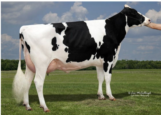
SYNERGY UNO POT O GOLD FIFTH DAM